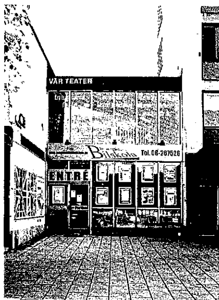
Karaktärrsskapande länkbyggnad med glasfasader vid Brommaplan.

I centrumbebyggelsen vid Brommaplan uppfördes under andra hälften av 1950-talet kvarteret Pundet 1, ett hotell med karaktär av motell. Byggnaden har en tidstypisk arkitektur som trots vissa förändringar och tillbyggnader bevarar sin ursprungliga utformning. Den kringbyggda gården är välgestaltad och bidrar till anläggningens kulturhistoriska värde. Strax intill ligger Grammet 1 från början av 1960-talet som uppfördes som medborgarhus med både social- och kommersiell service. Byggnaden har en tidstypisk välgestaltad utformning och är en viktig markör för Brommaplan.