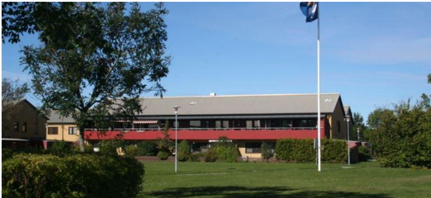
Riksbyggen Visbyhus 18

För allas trivsel har vi samlat information som vi vill att ni tar del av.