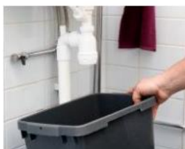
Ställ en hink under handfatet