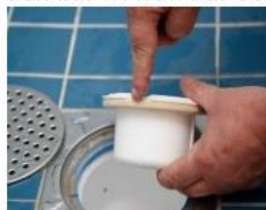
3. Se till att packningen sluter tätt