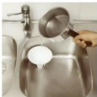
1) Spola kokhett vatten rakt ner i avloppet - blanda i lite diskmedel.