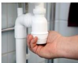
Skruva loss underdelen av vattenlåset