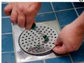
1. Lyft silen