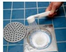
4. Fyll vattenlåset med vatten igen.