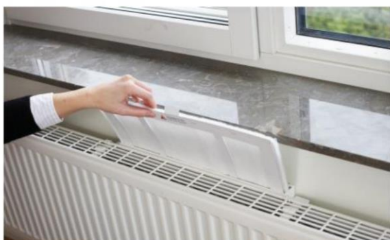
Att byta filter är enkelt eftersom filtret är böjbart

Filter bör bytas en gång per år, och kan köpas från www.acticon.se .