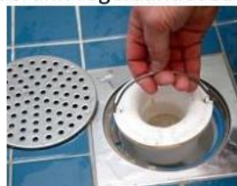
2. Lyft vattenlåset och rensa in- och utsidan