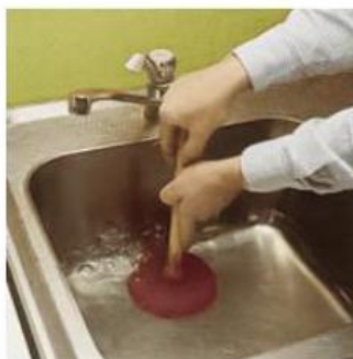
2) Använd en vaskrensare – se till att vattnet täcker gummit.