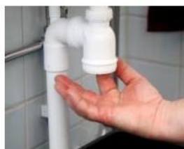
Rensa bort all smuts. Skruva tillbaka och se till att det håller tätt.