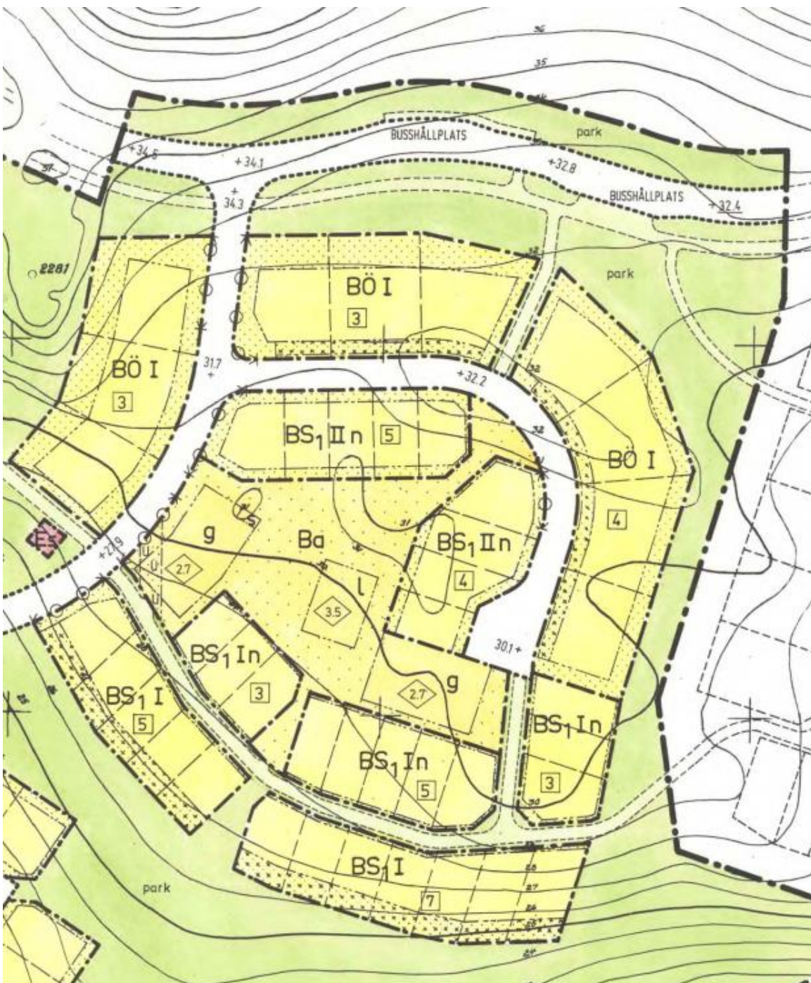
Utdrag ur Detaljplan 118