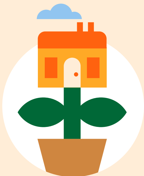
Skapa ett hållbart boende med Boappa

Boappa underlättar kommunikationen och ökar engagemanget på ett enkelt och kul sätt genom att ersätta: