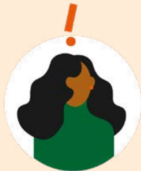
Förenkla styrelsearbetet med Boappa

Med Boappa digitaliserar ni föreningens bokningssystem och sparar både tid och pengar.